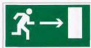
Направление к эвакуационному выходу направо