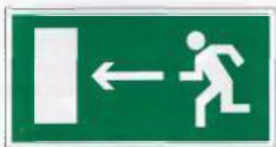
Направление к эвакуационному выходу налево