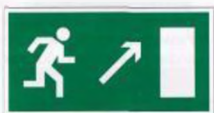
Направление к эвакуационному выходу направо вверх