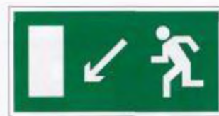
Направление к эвакуационному выходу налево вниз