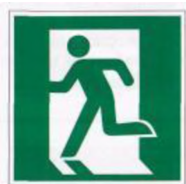
Выход здесь (левосторонний)