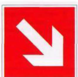
Направляющая стрелка под углом 45°