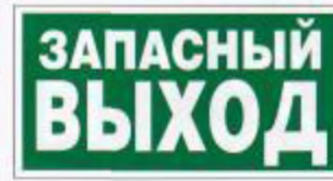
Указатель запасного выхода