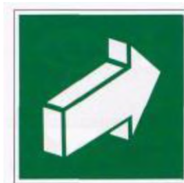
Открывать движением от себя