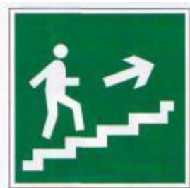
Направление к эвакуационному выходу по лестнице вверх