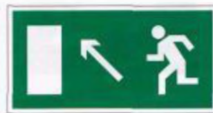
Направление к эвакуационному выходу налево вверх