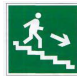
Направление к эвакуационному выходу по лестнице вниз