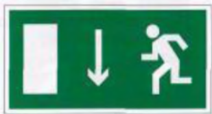
Указатель двери эвакуационного выхода (левосторонний)