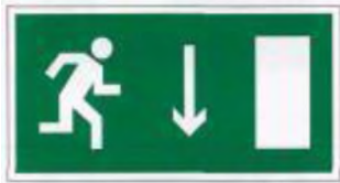
Указатель двери эвакуационного выхода (правосторонний)