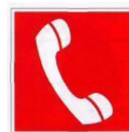
Телефон для использования при пожаре