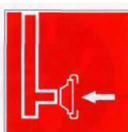
Пожарный сухотрубный стояк