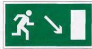
Направление к эвакуационному выходу направо вниз