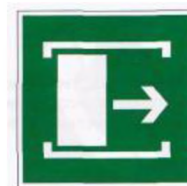
Для открывания сдвинуть