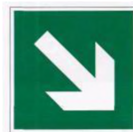
Направляющая стрелка под углом 45°