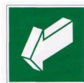
Открывать движением на себя