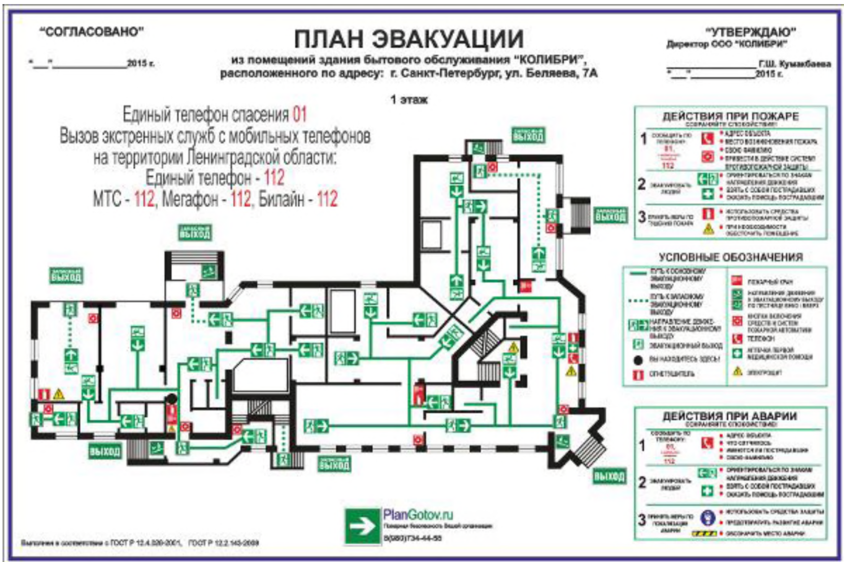
Общий план эвакуации 1-го этажа.