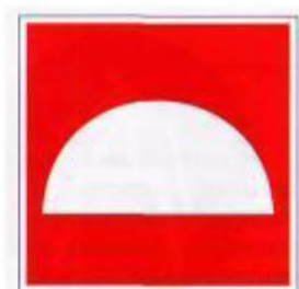
Средства противопожарной защиты