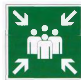
Пункт (место) сбора