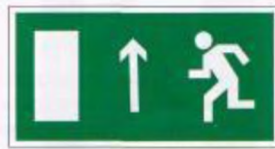
Направление к эвакуационному выходу прямо