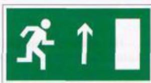
Направление к эвакуационному выходу прямо