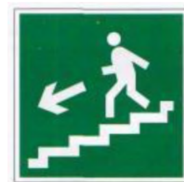
Направление к эвакуационному выходу по лестнице вниз