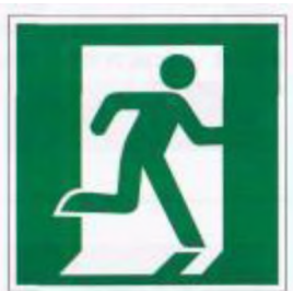
Выход здесь (правосторонний)