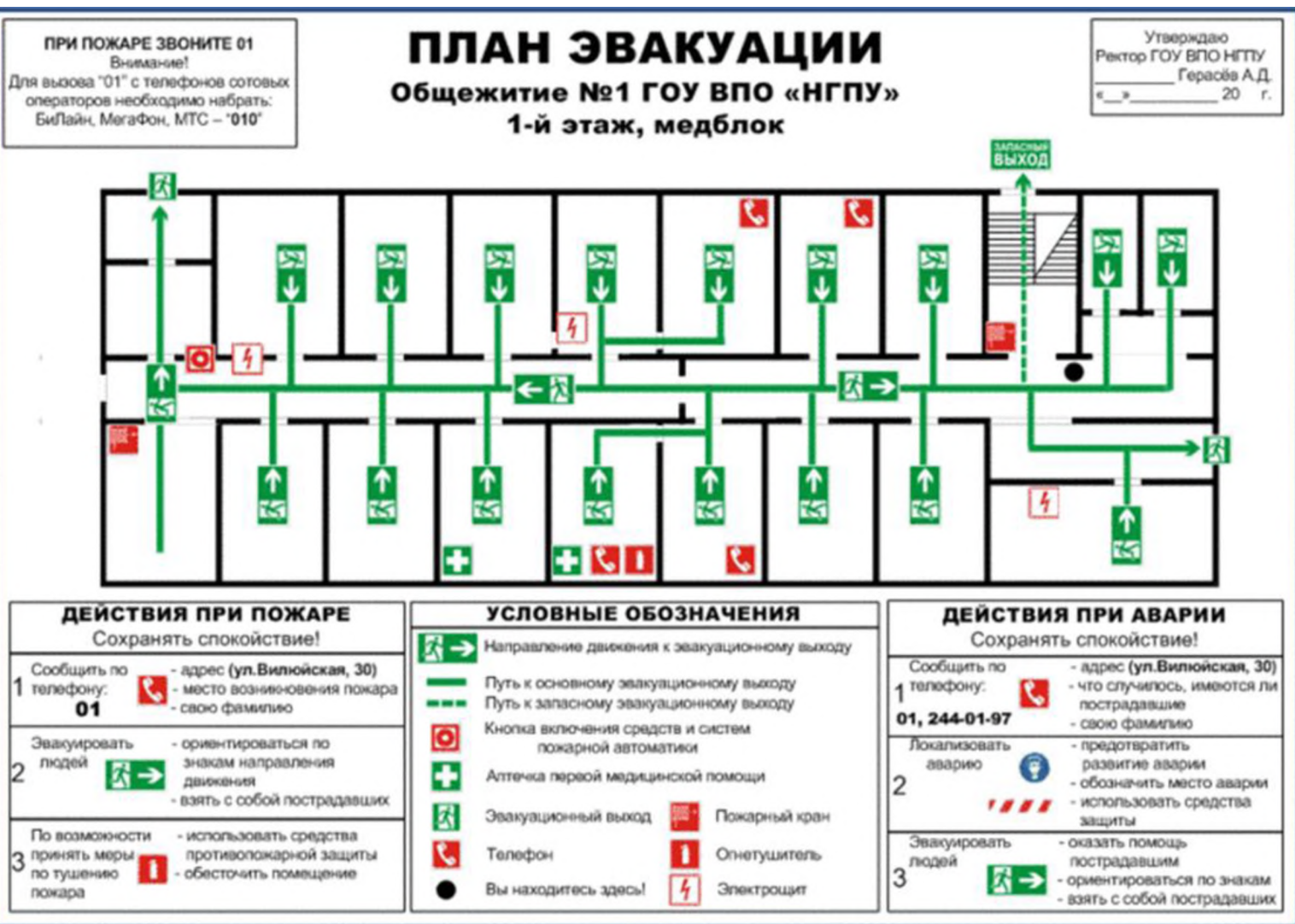
Этажный план эвакуации