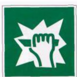
Для доступа вскрыть здесь