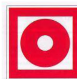
Кнопка включения пожарной автоматики